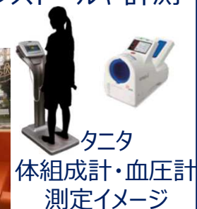
タニタ 体組成計・血圧計 測定イメージ